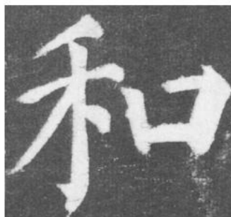
【乙】取自唐代颜真卿《颜勤礼碑》