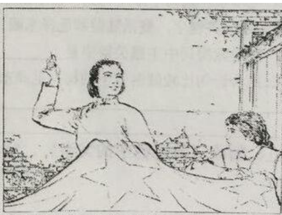
116. 江姐激动地说：“破坏一个旧中国，建设一个新中国，这是多么壮丽的事业。我们的革命，对人类，应该作出更大的贡献！”李青竹赞同地说：“这该有多美、多好啊！”

(2) 上面连环画讲述了_____的情节，图中人物除了江姐，还有_____，这个情节集中表现了江姐英雄的革命精神。