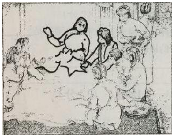
115. 珍藏的红旗拿出来了，这是“监狱之花”母亲的遗物。人们团团围上来，尽管不知道五星红旗的图案，但她们都把欢乐的激情寄托在针线上，织绣出闪亮的红星。