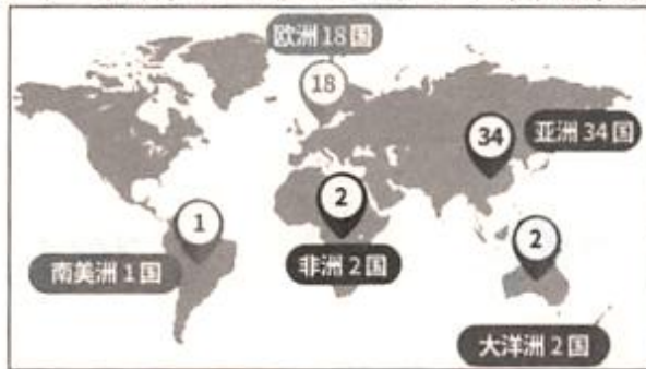
“亚投行”创始成员国分布图

材料三 亚洲基础设施投资银行（亚投行）是首个由中国倡议设立的多边金融机构。截止 2017 年 5 月，成员国增至 77 个，涵盖了主要西方和东方国家。“亚投行”旨在树立双赢、共赢的新理念，在追求自身利益时兼顾他方利益，在寻求自身发展时促进共同发展