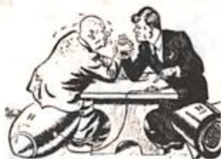
赫鲁晓夫和美国总统肯尼迪的较量（漫画）