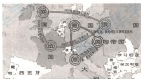
“一战”前欧洲形势示意图