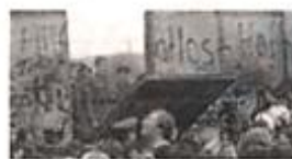
1989 年柏林墙坍塌, 东西德统一