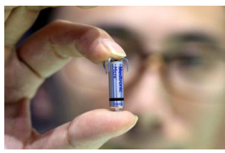
2克重的心脏起搏器 图2