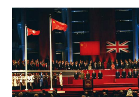
③恢复对香港行使主权