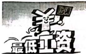
A. 提高最低工资标准，消除收入差距