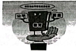
B. 促进教育公平，教育改革全面推进