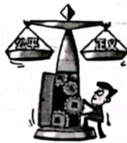
D. 推进司法改革，捍卫公平正义的第一道防线