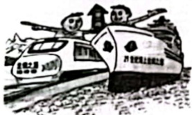
C. 共建“一带一路”，实现国内外同步发展