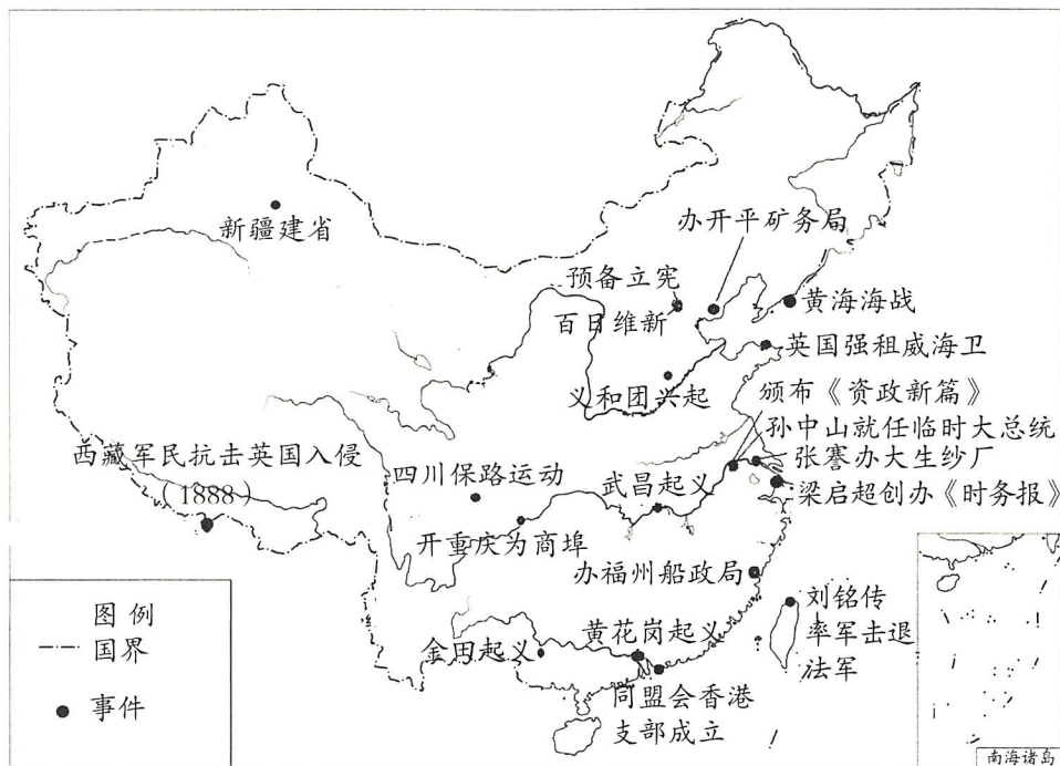
晚清时期重大历史事件(部分)示意图

结合地图中的信息和所学, 任选3个视角, 简述晚清时期中国历史的发展演变。(10分)