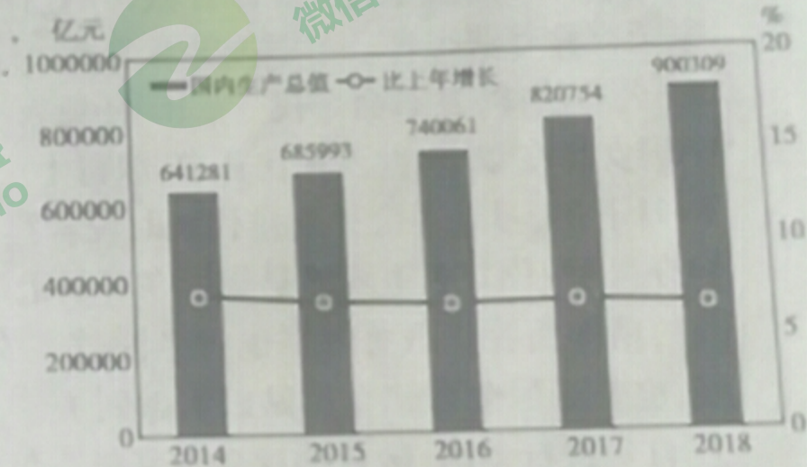
图 1 2014-2018 年国内生产总值及其增长速度