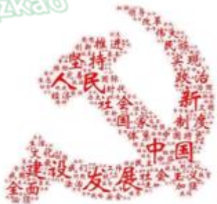
十九大报告高频词

▷党的十九大对 2020 年全面建成小康社会以后，作出两个阶段的战略安排。第一步，从 2020 年到 2035 年，在全面建成小康社会的基础上，再奋斗 15 年，基本实现社会主义现代化，第二步，从 2035 年到 21 世纪中叶，在基本实现现代化的基础上，再奋斗 15 年，把我国建成富强民主文明和谐美丽的社会主义现代化强国。