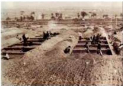
图一 河南登封王城岗遗址