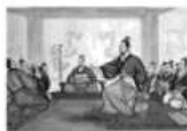
商鞅舌战守旧贵族