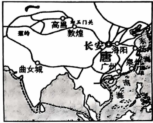
图8 唐代主要交通路线示意图