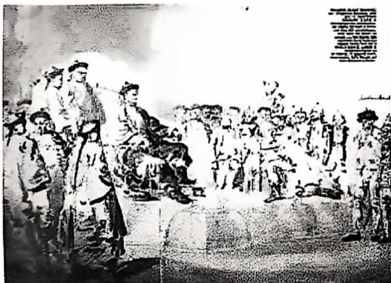
马戛尔尼觐见乾隆皇帝

左图是英方随团画师威廉·亚历山大所绘的马戛尔尼觐见乾隆皇帝的场景。被朝臣簇拥着正襟危坐于中央的乾隆皇帝面露威严，马戛尔尼单膝跪拜献上英王乔治三世亲笔信。