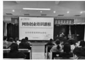
④开展创业技能培训