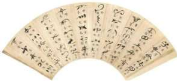
图 a 军粮经纪密符扇

验粮官要使用一个验粮盘（图b）查看漕粮的质量。这件验粮盘为杉木制，呈①斗型，斜壁，平底，口边长29.2厘米，高5厘米，底边长26厘米，榫卯相接，结实耐用。负责检查漕粮的官员将散装的粮食放在验粮盘内查看，以粮食②为合格。