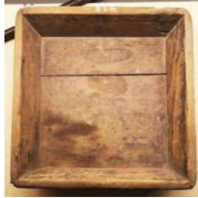
图 b 验粮木盘

4. 请你根据文中密符的特点，用“既……又……”的句式将下面的句子补充完整。（2分）