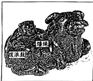
藏品二(清)牧童骑牛