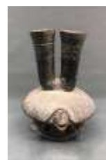
南北朝黑釉龟形双投壶