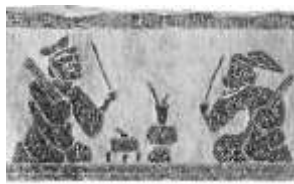
投壶汉画像石（局部）