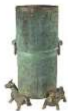
战国中山王墓铜投壶