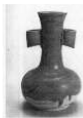
宋-金磁州窑黑花投壶