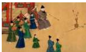
明朱瞻基行乐图（局部）