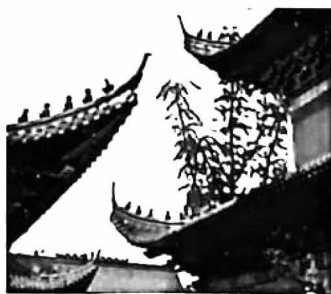
建筑中的“钩（勾）心斗角”

建筑是凝固的历史，美轮美奂；成语是凝固的语言，包罗万象。建筑使成语生动可感，成语则赋予建筑更多的文化内涵，二者相得益彰，真可谓棋逢对手。如“雕梁画栋”，在栋梁等木结构上雕刻花纹并加上彩绘，指房屋华丽的装饰。如“钩（勾）心斗角”，原指宫室结构精巧，飞檐相互交错，现比喻人与人之间的明争暗斗……在漫长的岁月中， 这些含有建筑细节的成语，都保护了与建筑相关的原义，没有发生语义演变。