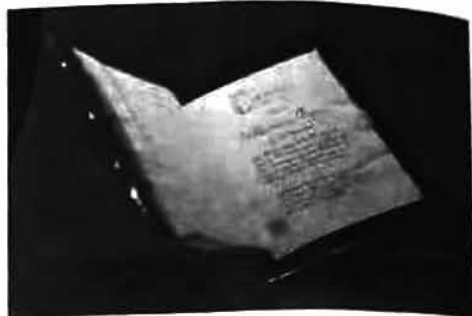
法文本《论语导读》 (法)弗朗索瓦·贝尼耶译,1688 年抄本

牛皮封面、飘口烫金、书口刷红……作为法国国礼的《论语导读》如今典藏于中国国家图书馆。《论语》的早期翻译和导读曾对孟德斯鸠和伏尔泰的哲学思想给予启发。17 至 18 世纪,中国的思想、文化和技术“东学西传”,促成欧洲不断认识中国、改进自身,感受中华文明的深厚积淀。