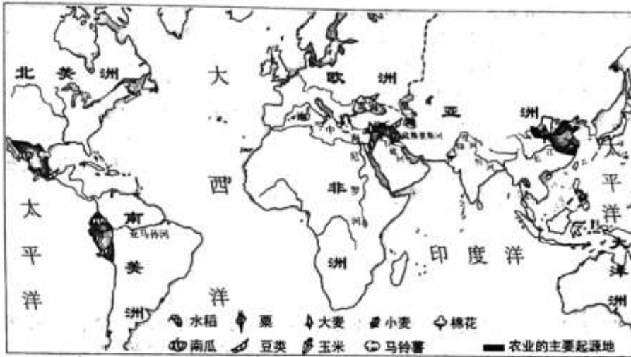
世界农业的主要起源地分布示意图