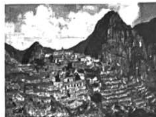
印加马丘比丘城遗址