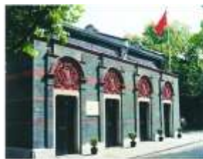
②中国共产党第一次全国代表大会会址