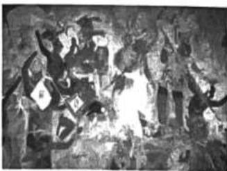
玛雅波南帕克神庙壁画