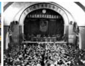
④中国共产党第七次全国代表大会会址