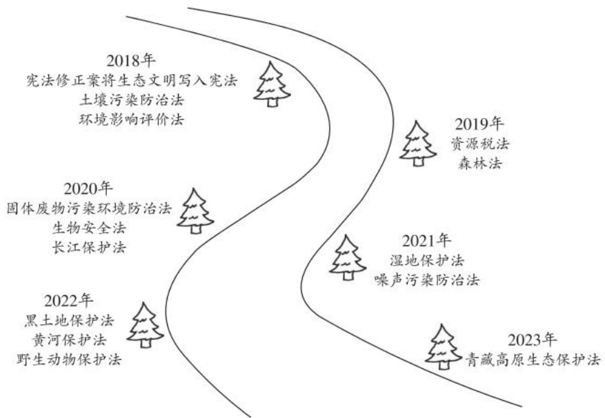
美丽中国的法治足迹示意图

今天, 我国生态环境法治建设取得显著成效: 河长制带来河长治, 一幅幅鱼翔浅底、人水相亲的图画徐徐铺展; 日益完善的湿地生态补偿制度, 让保护生态不吃亏、能受益的局面渐成常态……美丽中国的法治足迹铺陈延伸, 让祖国的天更蓝、山更绿、水更清。