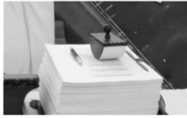
签署中国加入世贸组织法律文件时使用的文具