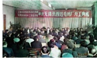
④乡镇企业异军突起