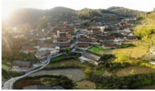
①“精准扶贫”首倡之地十八洞村

11. 党的十八大以来，中国特色社会主义进入了新时代，这是我国发展新的历史方位。下列四组图片中能够反映新时代的伟大成就是的