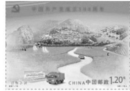
建党百年纪念邮票 《摆脱贫困》