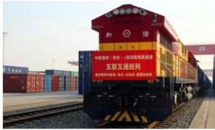
③共建“一带一路”项目中欧班列